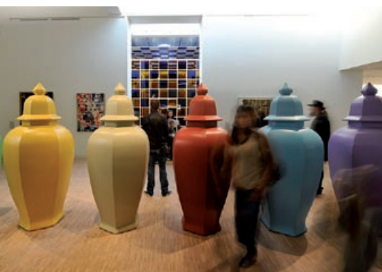
Allan McCollum, Perfect vehicles , 1988. LaM, Villeneuve d'Ascq © McCollum, 2011.