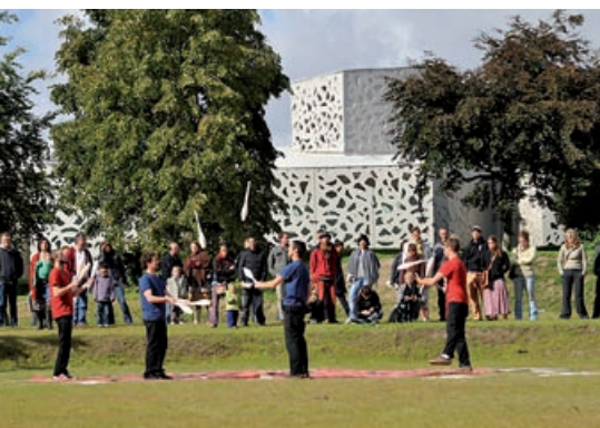
Légende. Photo : Max Lerouge / LMCU © Manuelle Gautrand Architecture