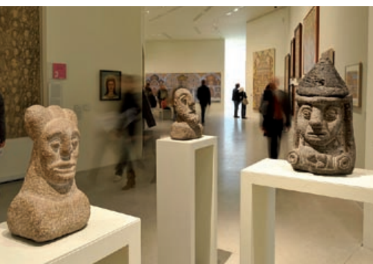
Vue des salles d'art brut du LaM. Au premier plan : Anonyme (dits les Barbus-Müller) . Donation L'Aracine.