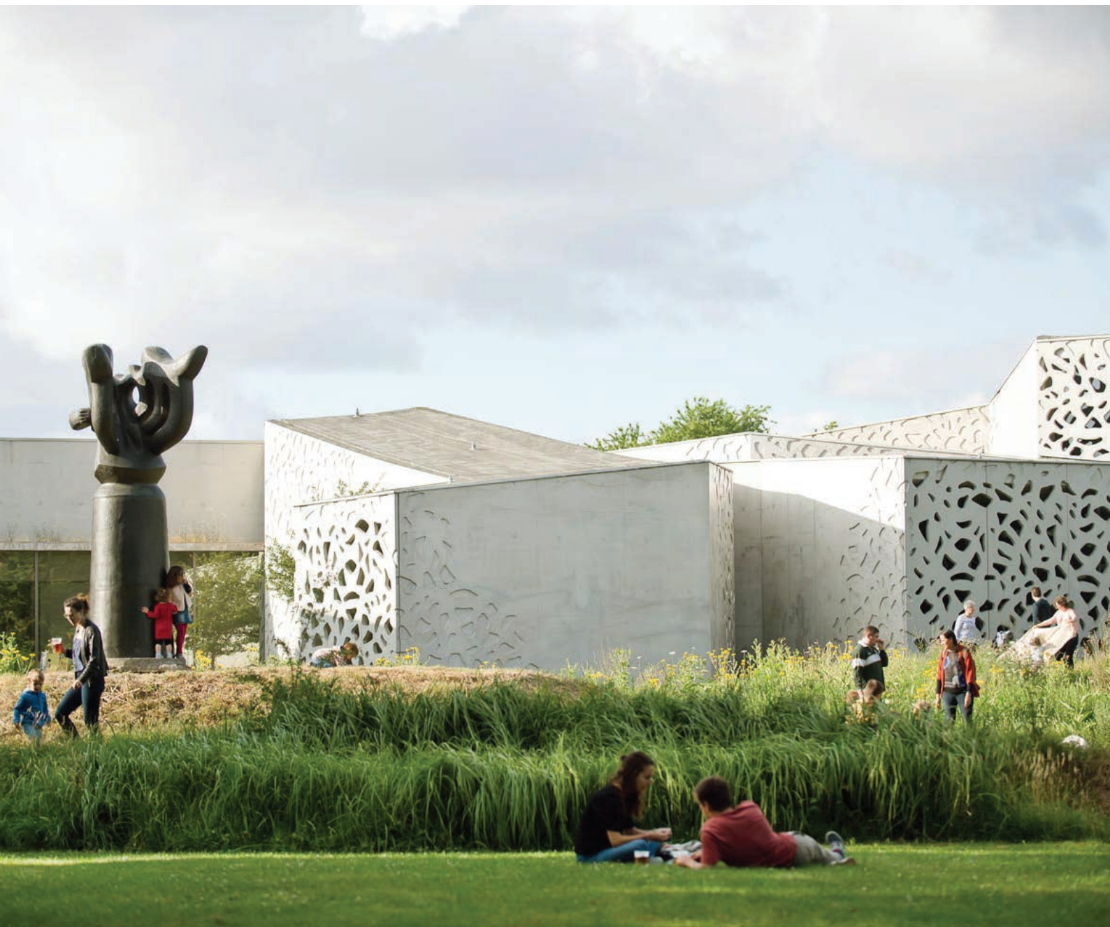
Vue extérieure du LaM, Villeneuve d'Ascq. À gauche : Jacques Lipchitz Le Champs Des Voyelles, 1931-1932