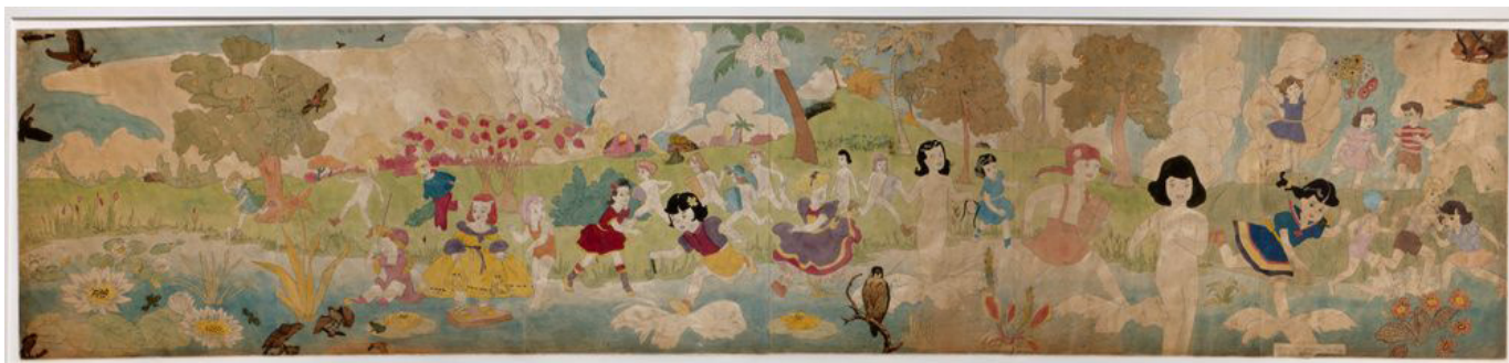
Henry Darger, 161 at Jennie Richee. 7 Rapped, 1950-1960

Et si vous êtes très inspiré.e, comme Henry Darger, commencez un cahier pour écrire une histoire incroyable sur des milliers de pages !