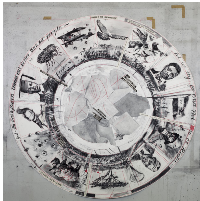
William Kentridge, Untitled (dessin pour The Head & the Load, Tondo II) , 2018.

Depuis le 5 février 2020, le LaM présente la première grande rétrospective en France de l'artiste sud-africain William Kentridge. À la croisée des disciplines, mêlant arts plastiques, performance, théâtre et opéra, l'œuvre de l'artiste, particulièrement enracinée dans l'histoire de son pays et notamment sa ville natale Johannesburg, propose un voyage hypnotique à travers une œuvre qui ne cesse d'envoûter.