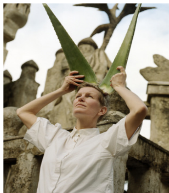
Portrait de Laure Prouvost.

Cet automne, Laure Prouvost s'empare du fonds d'art brut du musée afin de le faire dialoguer avec l'installation jubilatoire et débridée qu'elle proposait à Venise.