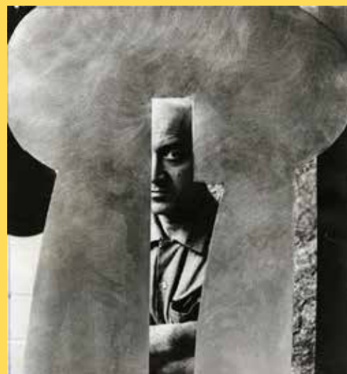
Portrait d'Isamu Noguchi, 4 mai 1961.

Exposition co-organisée avec le Barbican Center (Londres), le Musée Ludwig (Cologne) et le Zentrum Paul Klee (Berne), en relation étroite avec la Fondation Noguchi (New York).